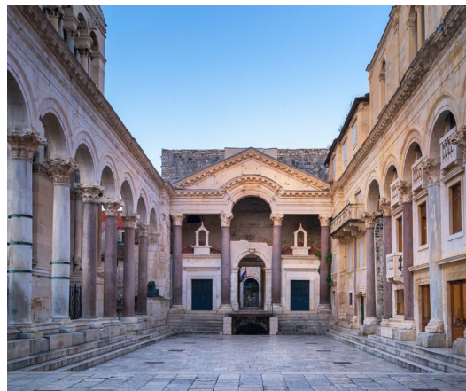
Palais de Dioclétien