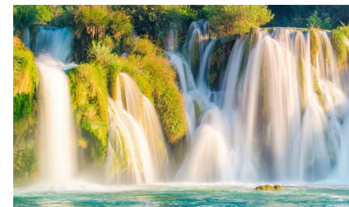
Les Cascades de Krka