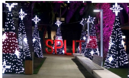
La Riva illuminée