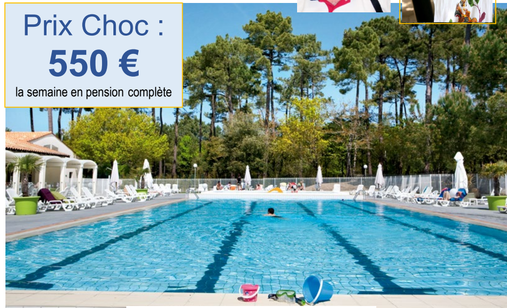
Club Belambra « Les Mathes » piscine chauffée