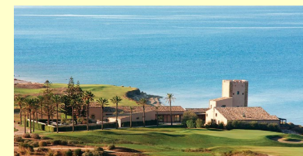
Sciacca – deux parcours de golf