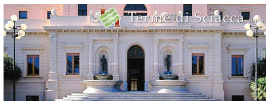
Sciacca – Station thermale renommée

L'ordre des tournois et des sorties pourra être modifié pour s'adapter aux circonstances locales