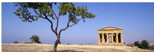
Agrigento – Vallée des Temples

Base parfaite aussi pour les visites des nombreux sites historiques