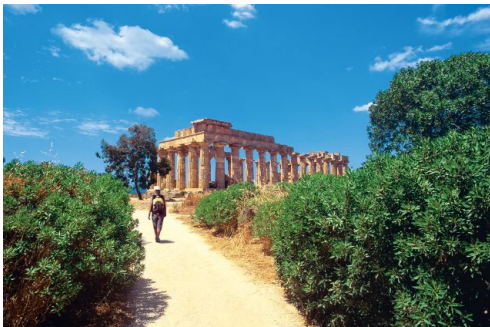
Selinunte, temple en pleine nature

Le Lookéa Cala Regina**** est proche de Sciacca, charmante ville thermale du sud-ouest de la Sicile.