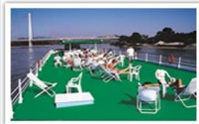
Grand pont soleil

Formalités : Carte Nationale d'Identité ou Passeport en cours de validité