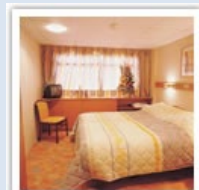
Cabines, toutes avec salle d'eau et grande fenêtre

Toutes cabines équipées de douche et wc, sèche-cheveux, coffre, TV, radio, fenêtres, climatisation, deux lits bas ou un grand lit,