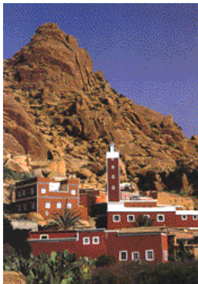
Village de Tiznit, un des buts d'excursion

Envie d'un peu de soleil au cœur de l'hiver ? Agadir vous ouvre grand les portes du Sud Marocain. Ville moderne, plus grande station balnéaire du Maroc, Agadir est toujours attirante à cette période de l'année, où la plage immense reste bien souvent très ensoleillée, et où le ciel est d'un bleu limpide qui met en valeur l'ocre rouge de l'architecture traditionnelle marocaine.