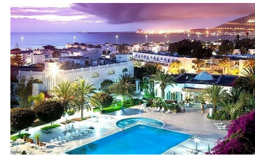
Hôtel-Club Les Jardins d'Agadir

Matinée : encore choisir entre plage ou piscine,