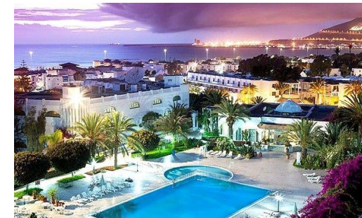
Les Jardins d'Agadir