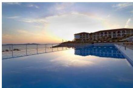
Piscine immense surplombant la mer

A proximité de sites grecs fascinants, comme le Mont Athos, et les Météores, et néanmoins au calme, l'hôtel Akrahtos, bénéficie d'une situation exceptionnelle, vue sur la mer et les îles. Avec le bridge, voilà des vacances dynamiques mais relaxantes. Yamas !