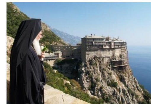
Mont Athos, un lieu sacré

Vendredi 1 er juin Retours sur la France.