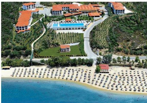
Une petite route pentue ou une passerelle avec un escalier mènent à la superbe plage de sable