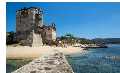
Le village d'Ouranopolis, à 2,5 km de l'hôtel