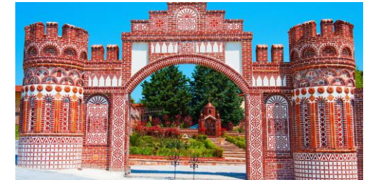
Le monastère de Dionysos