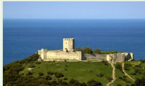
Château de Platamonas

16h30. Tournoi SimultaNet avec Handicap les douze meilleures donnes sont analysées par l'expert en la matière Philippe Soulet. Un bonus avantage les joueurs de classement plus modeste.