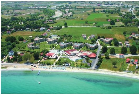
Un grand domaine, en bord de plage, abrite sept petits bâtiments de deux étages