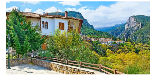
Sur la route du Mont Olympe