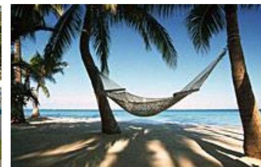
Plage, Bridge, ou Hamac?

La formule de bridge la plus pure, mais aussi