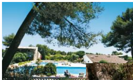
Parc aux oliviers centenaires

Bar lounge avec terrasse Piscine avec 3 bassins 3 courts de tennis 2 terrains de pétanque Animations en soirée