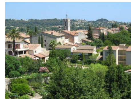
La Colle sur Loup

Matinée. Stage jeu de la carte: Signalisation sur l'entame à l'atout