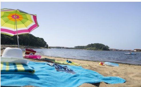
La plage de sable, aménagée au bord du lac marin

l'une Championne de France en titre, et son mari 3 fois vainqueur de la Coupe de France, non seulement pédagogues et organisateurs avertis, mais aussi qui savent cultiver le convivialité, propre aux Balades Bridge