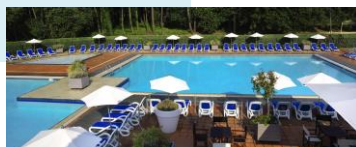
Piscine chauffée avec trois bassins et un bar lounge avec terrasse couverte