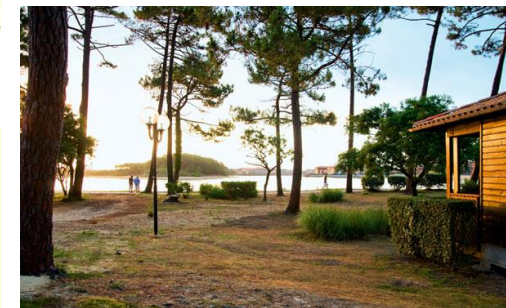
Un cadre naturel au bord du lac marin

Avec Handicap un bonus vient encourager les paires de classement plus modeste.