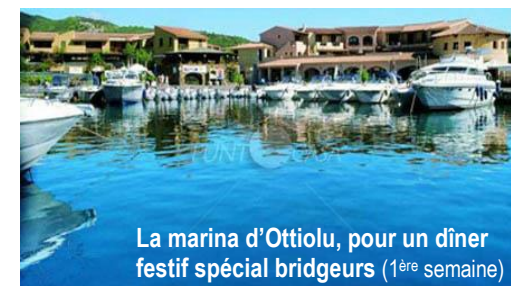
La marina d'Ottiolu, pour un dîner festif spécial bridgeurs (1 ère semaine)

Nouvelles dates : du 31 août au 14 septembre départ de Paris