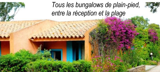
Tous les bungalows de plain-pied, entre la réception et la plage