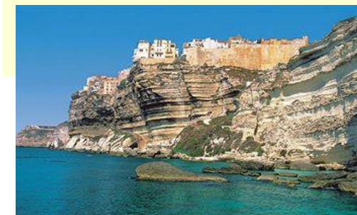
Les falaises de Bonifacio

Les horaires des activités bridge et tourisme peuvent être modifiés en fonction des impératifs locaux