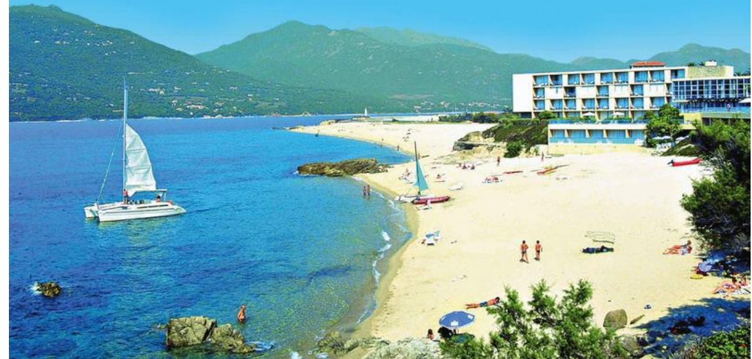
Hôtel-club Belambra Arena Bianca, posé sur la plage