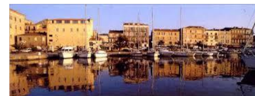
Propriano – le port de plaisance