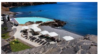
Petite plage mais grande piscine d'eau de mer qui déborde... sur la mer