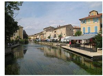
L'Isle sur la Sorgue, Venise du Comtat