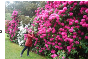
Rhodod géants dans le parc de Muckross

20h. Tournoi dans le cadre du Bridge Event