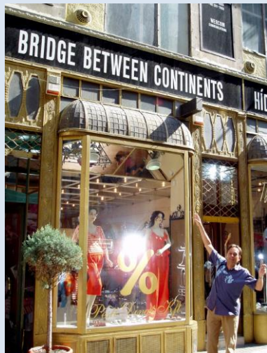
Dans une rue de Budapest...

Toutes cabines équipées de douche et wc, sèche-cheveux, coffre, TV, radio, fenêtres, climatisation, deux lits bas ou un grand lit, Wifi gratuit au salon-bar. Et une table qui fait les délices des bridgeurs les plus exigeants.