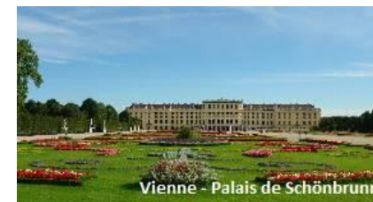
Vienne - Palais de Schönbrunn

Dynamique : Découvrez les coulisses du célèbre Konzrthaus et dégustez le fameux café viennois. L'après-midi excursion commune aux deux forfaits, la Hofburg : le palais des Habsbourg, le musée de