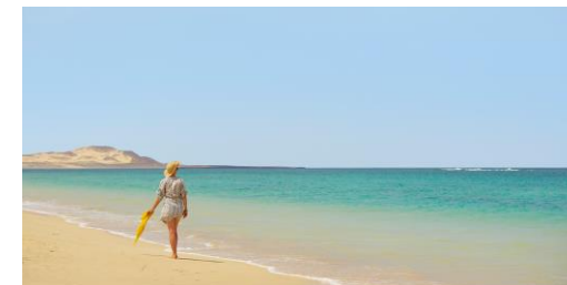
Vila do Farol, sur la plage immense exactement

16 h BRIDGE Tournoi par Paires. Joué sur Octopus, avec les huit meilleures donnes