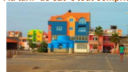
Santa Maria, un bourg aux couleurs pimpantes

Il ne faut que 5 h 30 de vol pour rejoindre depuis Paris l'archipel du Cap Vert, confettis de petites îles dispersées dans l'Atlantique, au large des côtes du Sénégal. Impossible de rester indifférent au charme du club Vila do Farol. Premier atout : la grande plage de sable blanc, la plus belle de l'île. Idéale pour de longues promenades, dans un véritable coin de paradis. Bien plus calme qu'ailleurs au Cap Vert, eau translucide, soleil tempéré par la brise, végétation superbe rare à Sal, cocktails au coucher du soleil, musique créole syncopée. Un concentré de bonheur. A 1,5 km de Santa Maria, à la population chaleureuse, empreinte de traditions portugaises. La température de la mer comme de l'air y est en moyenne de 24° à cette époque.