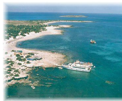
Île de Chrissi