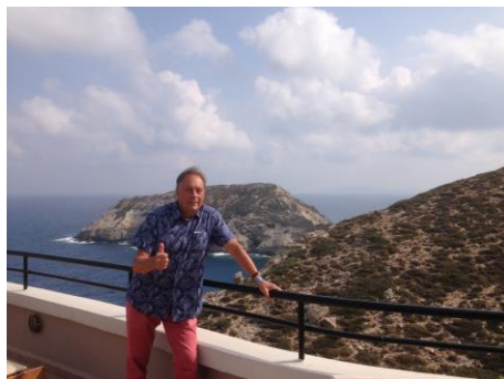
Une vue sublime depuis tous les recoins de l'hôtel

Équipements : 4 piscines extérieures et une intérieure chauffée, avec jacuzzi, 2 courts de tennis, beach volley, pétanque, aquagym, ping pong. Wifi gratuit Avec supplément Golf 18 trous et Spa /massages