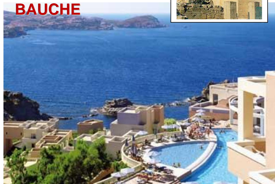
Hôtel-club Athina Palace*****