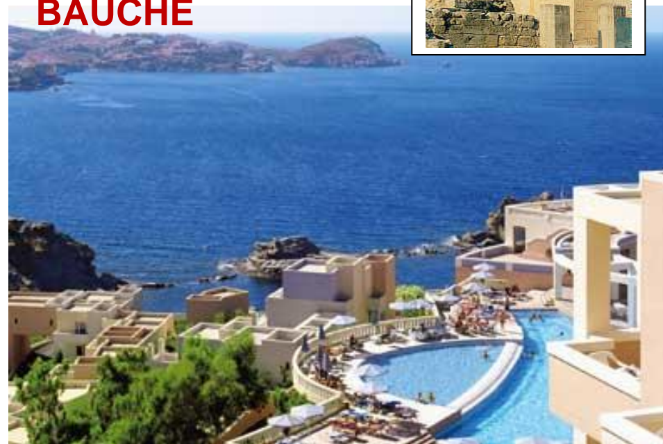
Hôtel-club Athina Palace*****