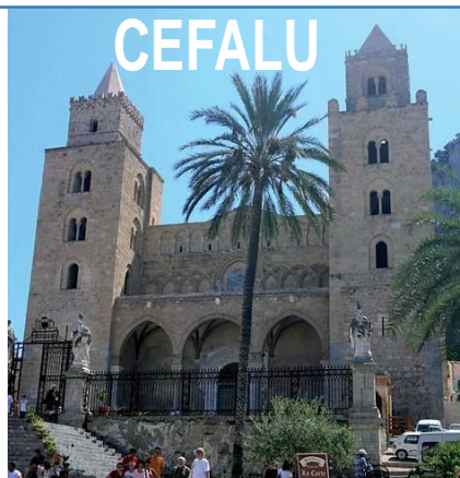
Cefalù, la cathédrale normande

Une terre à part, aux contrastes saisissants. Tantôt sombre, tantôt éclatante, à l'image de l'Etna dont les éruptions modèlent l'histoire de l'île. De la trépidante capitale Palerme aux temples grecs d'Agrigente, de la byzantine cathédrale de Monreale à la normande de Cefalù, de la station snob Taormina à la balnéaire Mondello, c'est un bon cocktail d'histoire, de culture, et de merveilles naturelles que vous pouvez déguster là.