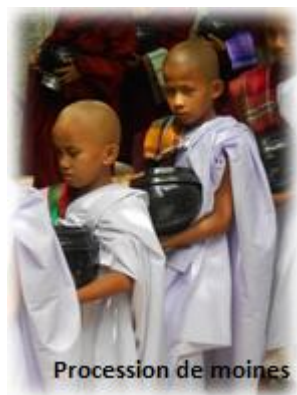
Procession de moines

Petit-d jeuner. Visite d' Ava qui fut 400 ans durant, la ville royale la plus importante du pays. Promenade en cal che au c ur des principaux vestiges du site de cette ancienne capitale dont le monast re Bagaya consid r  comme l'un des plus beaux monast res classiques en bois. Retour   bord pour le d jeuner. Sagaing est un haut lieu du bouddhisme birman. Temples, stupas, pagodes et monast res foisonnent et sont diss min s sur plusieurs collines. Visite d'un atelier d'argent puis du couvent de nones Tha Kya Thi Da . Continuation vers la pagode de Sun U Ponya Shin , construite au 14 me si cle et situ e au sommet de la colline de Sagaing. Vous profiterez d'une vue imprenable sur la ville de Mandalay et le fleuve Irrawaddy. BRIDGE. Mini-tournoi formule IMP . D ner et nuit   bord