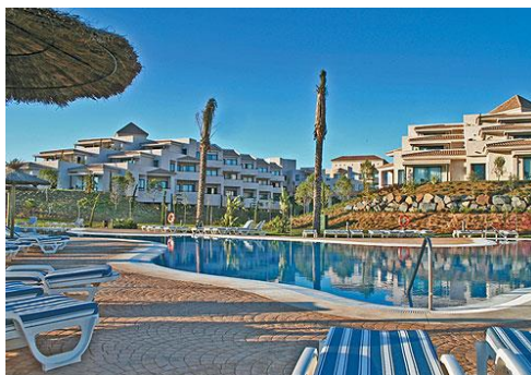
Un hôtel de luxe posé sur un golf.

La mer et le petit village de Rompido avec ses restaurants de poissons, sont à 1 km, accessibles par un chemin à travers le golf.