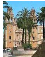
Huelva, la Merced

la chance de jouer avec, mais aussi contre, les meilleurs joueurs de la semaine. Ce tournoi peut aussi servir de terrain de chasse à ceux qui recherchent des partenaires.