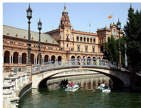
Séville, la Place d'Espagne

Journée libre pour une éventuelle excursion lointaine (facultative) vers CORDOUE, ou SEVILLE , que vous n'aurez qu'entr'aperçue avec le transfert aéroport.