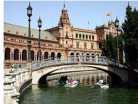
Séville, la Place d'Espagne

Journée libre pour une éventuelle excursion lointaine (facultative) vers CORDOUE, ou SEVILLE , que vous n'aurez qu'entr'aperçue avec le transfert aéroport.