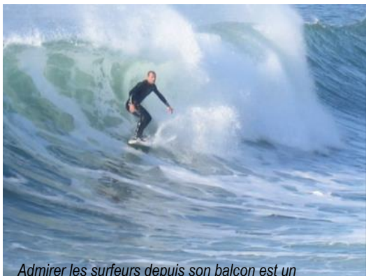
Admirer les surfeurs depuis son balcon est un spectacle captivant