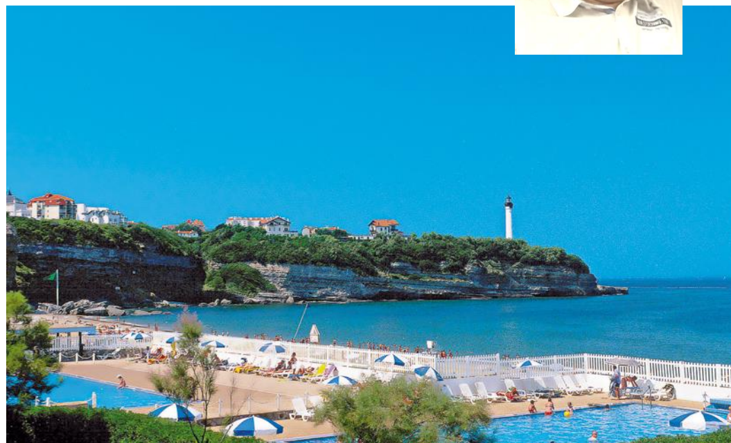
Au Club Belambra, face à l'océan et au phare de Biarritz