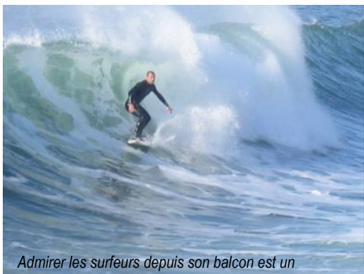
Admirer les surfeurs depuis son balcon est un spectacle captivant