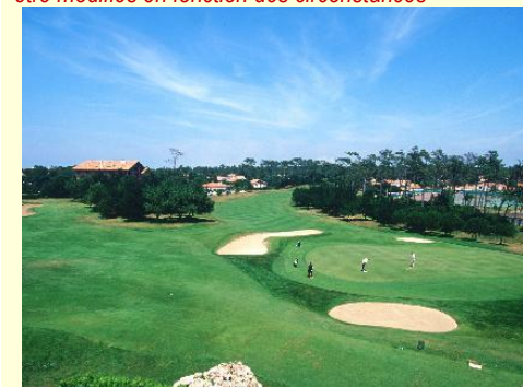
Golf d'Anglet, mais il y a aussi 14 Golfs dans un rayon de 30 km !

Les horaires des activités bridge et tourisme peuvent être modifiés en fonction des circonstances