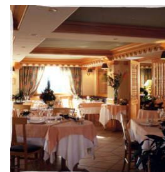
La table, un des atouts maîtres de L'Orée du Bois

Fin des prestations hôtelières après le petit déjeuner.