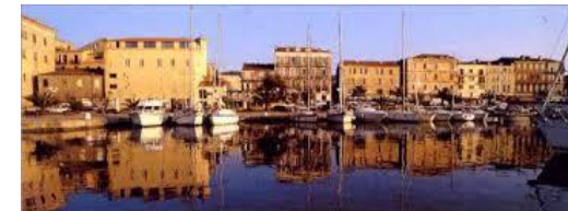
Propriano – le port de plaisance

14h30 Stage : Bicolores en intervention 16h30 : Tournoi dans le cadre du Simultané Tops7 , 7 donnes illustrent un mini-dossier