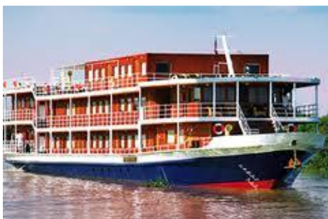
Le RV Indochine, 4 ancras de CroisiEurope,