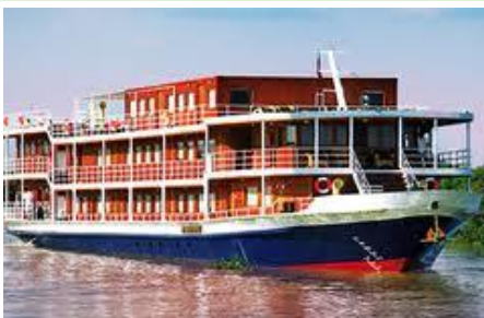
Le RV Indochine, de CroisiEurope, presque entièrement consacré aux bridgeurs

Ou possibilités d'extension Hanoi et Baie d'Halong , en 4 jours ou 7 jours