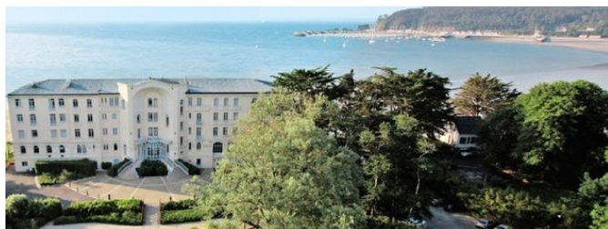
Le Grand Hôtel de la Mer, littéralement posé sur la plage