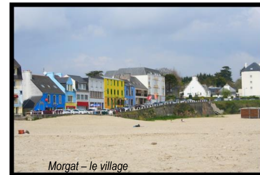
Morgat – le village

En soirée : Tournoi Paires Handicap où un bonus vient encourager les paires de classement plus modeste. Joué dans le cadre du simultané Octopus , davantage de points d'expert à briguer.