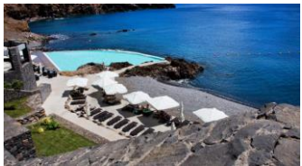
Petite plage mais grande piscine d'eau de mer qui déborde... sur la mer

Plage publique de Prainha (sable noir) à 2 mn en voiture Plage publique de Machico (sable blond) à 10 mn