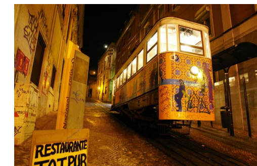
Spectaculaires tramways, à l'attaque des sept collines de la ville

Les horaires des tournois et des visites pourront être modifiés pour s'adapter aux circonstances locales