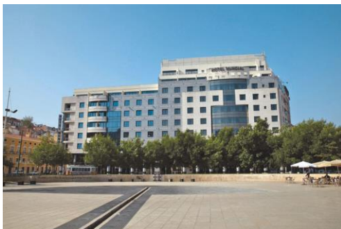
Le 4 étoiles le mieux situé de la ville