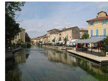
L'Isle sur la Sorgue, Venise du Comtat

14h30. Stage : Contre et surcontre dans les enchères de chelem : Lightner et ses copains