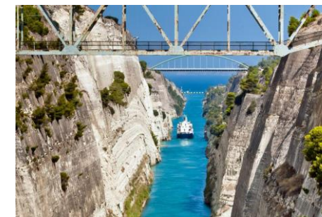
Canal de Corinthe

Journée libre pour vos excursions 21 h BRIDGE. TOURNOI « A LA CORINTHIENNE » . Vous ne rencontrez que des joueurs d'un classement proche du votre. La moitié des paires à l'indice le plus élevé dans un tournoi, l'autre moitié dans l'autre tournoi. Mais avec les mêmes donnes et un seul classement, au top intégral