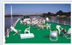
Grand pont soleil

Formalités : Passeport ou carte d'identité en cours de validité