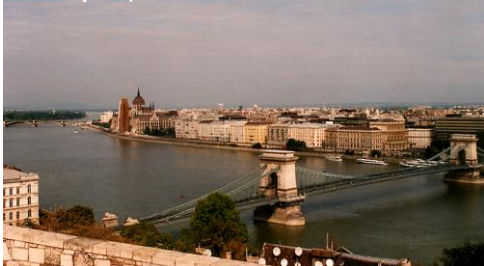
Budapest, le fameux Pont des Chaînes

Les horaires et l'ordre des escales et des activités bridge pourront être modifiés pour s'adapter aux circonstances ou au meilleur agrément des passagers.