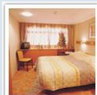
Cabines, toutes avec salle d'eau et grande fenêtre

90 cabines. Longueur 115m, largeur : 12m Un vrai bon confort, et bien sûr, pas de mal de mer à redouter. Toutes cabines équipées de douche et wc, sèche-cheveux, coffre, TV, radio, fenêtres, climatisation, deux lits bas ou un grand lit,