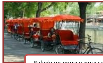
Balade en pousse-pousse

Petit-déjeuner. Transfert à l'aéroport et vol pour Paris. Arrivée à Paris.