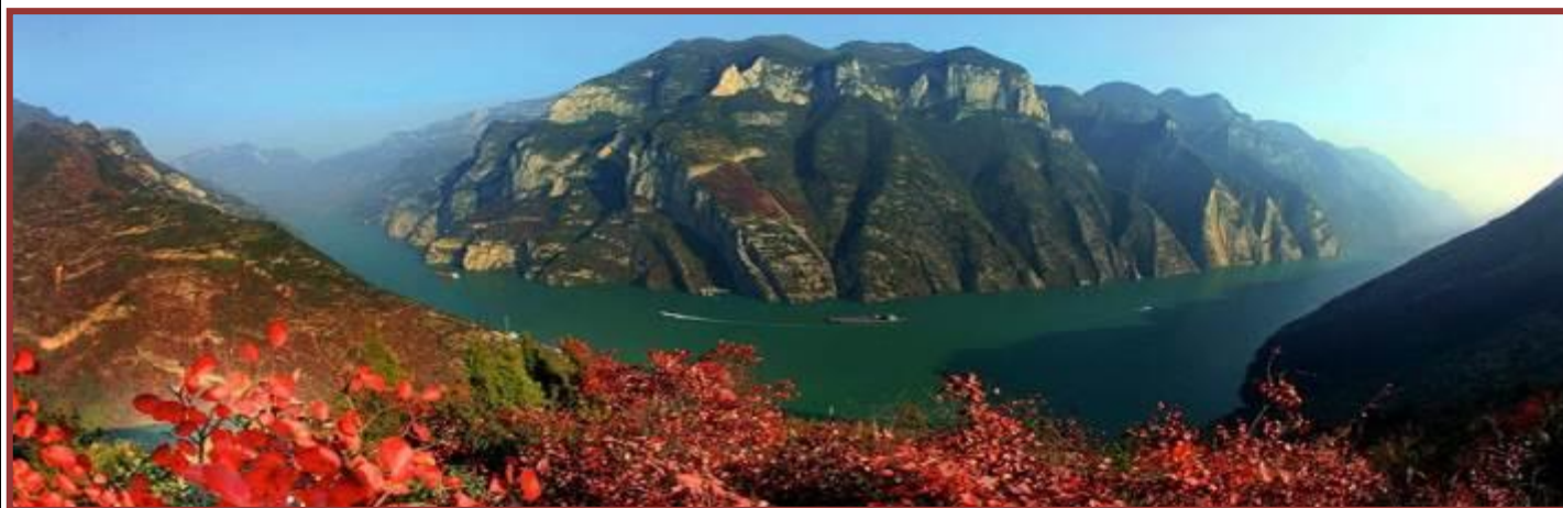
SHANGHAI – ZHUJIAJIAO – YICHANG – CROISIERE SUR LE YANGTSE KIANG - CHONGQING

Du 11 au 21 mai 2018 (11 jours/ 8 nuits)