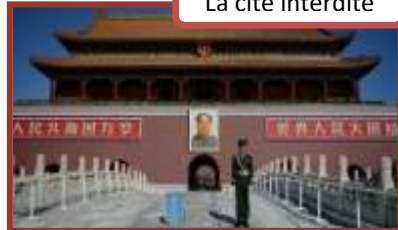
La cité interdite

Petit déjeuner. Visite de la Place Tien An Men et de la Cité Interdite , véritable ville dans la ville et ancienne résidence impériale des Ming et des Qing. Déjeuner. Visite du Temple du Ciel , lieu sacré de prière impériale à l'occasion des solstices. Dîner en ville. Spectacle de Kung Fu , art martial traditionnel et ancestral. Nuit à votre hôtel.