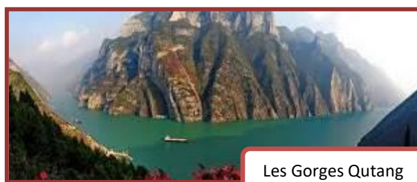
Les Gorges Qutang