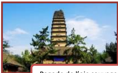
Pagode de l'oie sauvage

Petit déjeuner. Visite des chariots de bronze et de la Grande fosse aux 6000 guerriers et chevaux de l'empereur Qin, la plus surprenante découverte archéologique du siècle. Déjeuner. Découverte de la ville de Xi'an avec ses remparts édifés par le 1 er empereur de la dynastie des Ming. Visite de la pagode de l'oie sauvage , monument