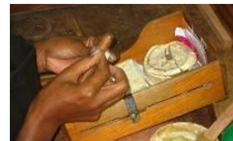
Fabrique de cigares « hecho a mano »

Arrivée à Paris Roissy dans la matinée Horaires et ordre des activités peuvent varier pour s'adapter aux circonstances locales.