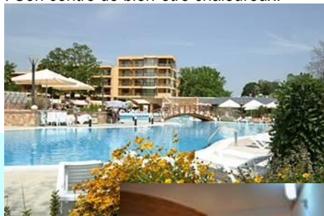
Grandes chambres avec vue sur parc ou sur mer