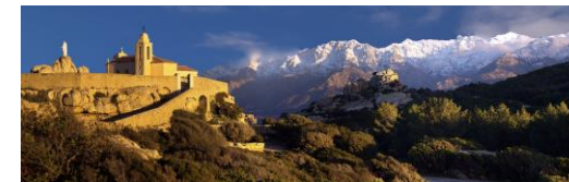
Calvi – Notre Dame de la Serra