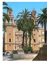
Huelva, la Merced

Matinée : On peut suggérer une excursion vers une des richesses touristiques de la région, Huelva, toute proche, dont l'attrait principal est le monastère de La Rabida, qui abrita Christophe Colomb à son départ pour les Indes. Non loin se trouvent les répliques de ses trois caravelles.