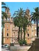
Huelva, la Merced