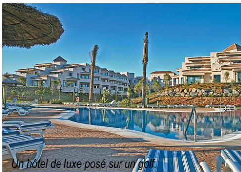
Un hôtel de luxe posé sur un golf.

Autre régal : la table. Déjeuner- buffet au Marismas, dîner servi au Rompido. Boissons comprises à volonté.