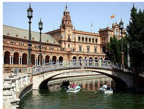
Séville, la Place d'Espagne

Journée libre pour une éventuelle excursion lointaine (facultative) vers CORDOUE, ou SEVILLE , que vous n'aurez qu'entr'aperçue avec le transfert aéroport.