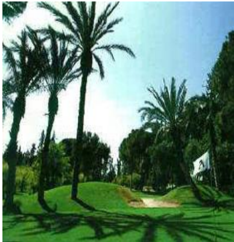
Les parcours de GOLF, un des principaux attraits de la destination

Cette station, quasiment européenne, est toujours attirante à cette période de l'année, où la plage immense reste bien souvent très ensoleillée, et où le ciel est d'un bleu